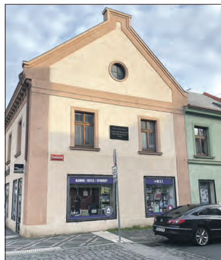
Pamětní deska na domě čp. 96 dnes.