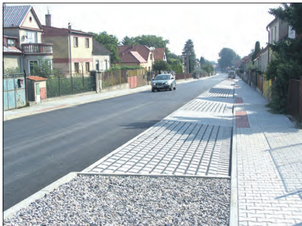
Rekonstrukce povrchů v ulicích Komenského a Školské bude navazovat na vydařenou revitalizaci ulice 5. května.

Ano, správně říkáte do konce února. Nevyužiji totiž zákonné možnosti nechat se uvolnit ve svém zaměstnání pro dobu výkonu funkce starosty, ale