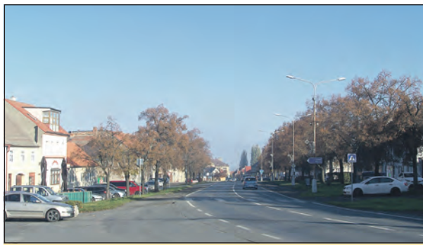
Na nového starostu teď čeká revitalizace středu města.

Zmiňoval jsem také čistírnu odpadních vod, což je jedna velká kapitola sama pro sebe.