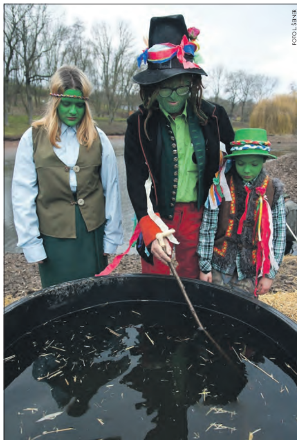
V sobotu 3. prosince se v královické hospůdce objeví vodníci Pepa, Říša a vodnice Eliška.

• Lidé k vám přijdou hlavně kvůli výtečným rybím pokrmům, ale já věřím, že pro ně máte připravený i nějaký rekreační doprovodný program? Dokončení na straně 4