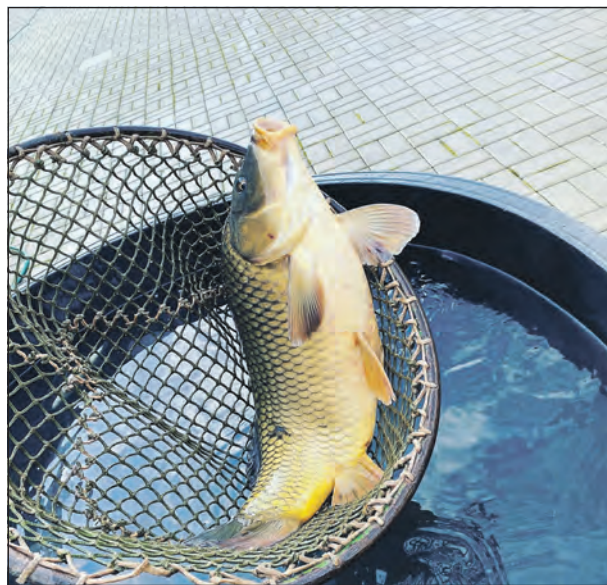
Zakoupit si zde můžete i pěkného vánočního kapra.

rybník se bude lovit až v příštím roce, ale to nic nemění na tom, že ryb budeme mít dostatečné množství, stejně jako skvělých pokrmů z nich. Prostor, kde se budou letošní Rybí hody odehrávat, bude bez výlovu našeho rybníka „zúžen“ na lokál restaurace a přilehlý sál.