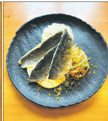
Ukázky rybích pokrmů.