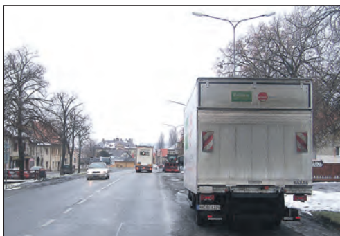
Kdy, či za jakých okolností přestanou parkovat kamiony a nákladní automobily na smečenském náměstí?

stav celého řadu vně budovy. Zde budeme muset přistoupit k rekonstrukci řadu. Vypsali jsme veřejnou soutěž na zhotovitele rekonstrukce obslužné cesty ke sběrnému dvoru a také