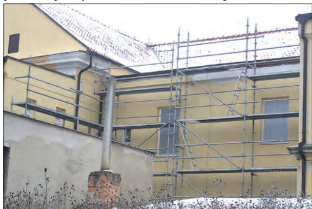
Na ZŠ Kačická právě probíhá oprava střechy.

● Jakmile se posledního února „odpoutáte“ od kri-