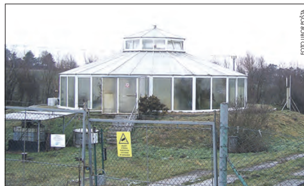
Intenzifikace čistírny odpadních vod je pro město Smečno na prostou nutností.