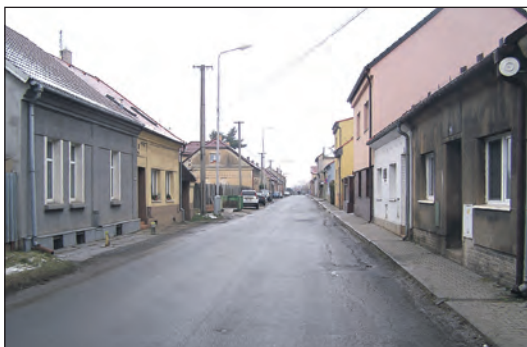
V této části Svinařovské ulice, po její levé straně, by měla vzniknout zpevněná parkovací stání.

s touhou být Smečnu prospěšný a něco dokázat. Samozřejmě, že se mi bude stýskat. Jak po práci samotné, tak zejména po kolektivu lidí, se kterými jsem měl možnost za ty dlouhé roky spolupracovat. V našem zaměstnání je to o maximální důvěře a kolegiálnosti. Proto je tam i tak velká kolegiální