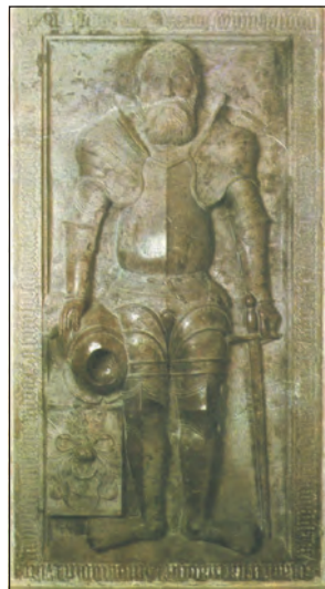
Náhrobek Jiříka Žďárského z roku 1574 v kladenském kostele.

rodová tvrz, kterou řadí Sedláček na konec 14. století, doložena je ale až k roku 1453 za Přecha z Kladna, se proto nazývala Hořejší tvrz.