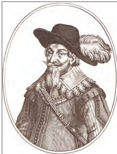
Saský generál Jan Jiří Arnim.