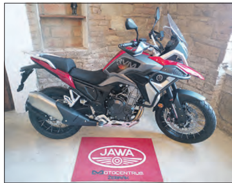
RWM 500 by Jawa (řadový dvouválec, zdvihový objem: 471 ccm).

Lotouš 1, 274 01 Slaný Po – Pá 8.00 – 17.00 Tel.: 603 176 116 www.autospicka.eu