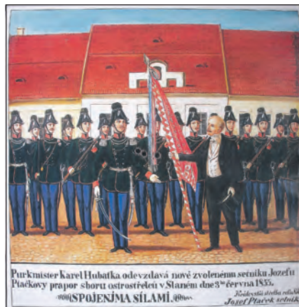
Terč pro Královskou střelbu roku 1856.