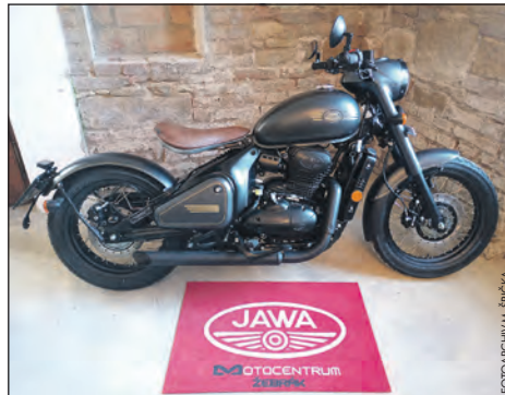
Jawa 350 CL Pérák (jednoválcový, kapalinou chlazený motor, zdvihový objem: 334 ccm).

Za jaké ceny je možné pořídit si tyto neobyčejné motocykly? „Ceny těchto motocyklů se pohybují od 99 tisíc Kč do 169 tisíc Kč. Takové cenové rozpětí je pro mnoho obdivovatelů této značky motocyklů určitě přijatelné,“ prozradil mně v závěru našeho sezení Michal Špička.