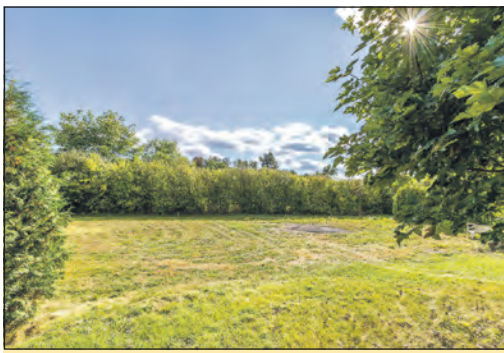
Nabídka stavebního pozemku ve Slaném – Kvíci.