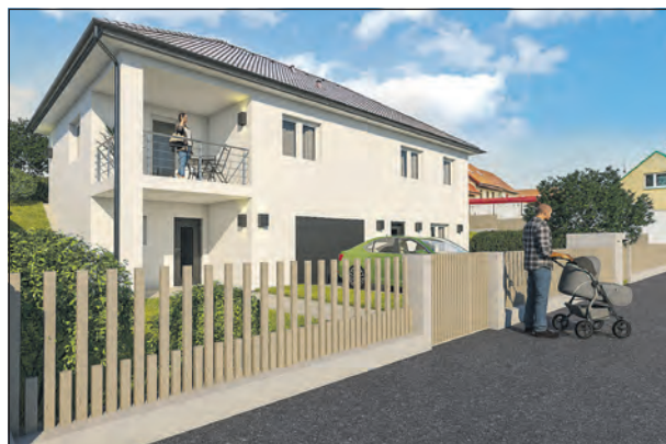
Vizualizace domu v obci Jedoměřice.