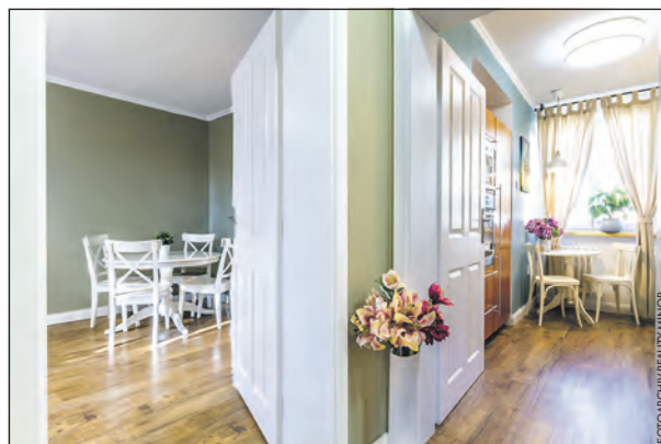
Nabídka bytu 3+1 v Kladně - Rozdělově.