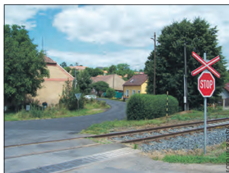
Nový asfaltový povrch byl v Břeštaněch položen v úseku od tohoto železničního přejezdu až za mostek přes Zlonický potok.

tudíž nějaká dělba práce, takže bych se chtěl zeptat, kte-