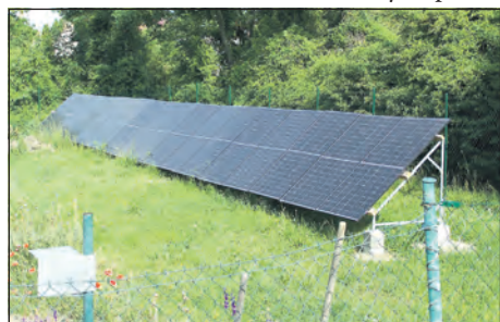
Další solární panely se nacházejí hned vedle budovy ČOV.