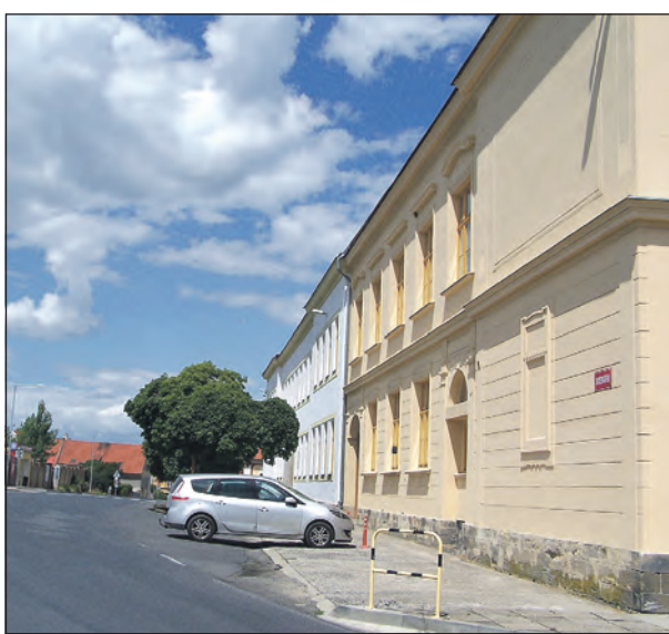
Nové kamery zlonického kamerového systému „pohlídají“ prostor před zlonickou školou, či autobusovou zastávkou.