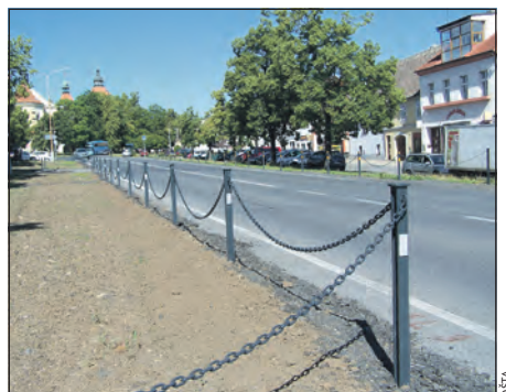
Sloupky s řetězy jsou již po obou stranách hlavní smečenské silnice.

V minulém vydání Slánských listů jsme psali o investici, která na náměstí T.G. Masaryka ve Smečně zamezí parkování kamionů na zeleni, zvýší bezpečnost smečenských občanů a prospěje i vzhledu hlavního smečenského náměstí. O instalaci sloupků s řetězy po obou stranách hlavní silnice a výrazném zvětšení zelených ploch na tomto náměstí.