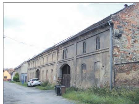
V této staré stodole v Denisovské ulici by mělo vzniknout nové zázemí zlonické technické čety.

a až potom můžeme pokračovat v bočních ulicích.