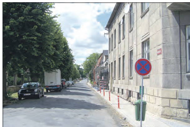
Nádražní ulice by měla být kompletně zrekonstruována od zdravotního střediska až k aleji.