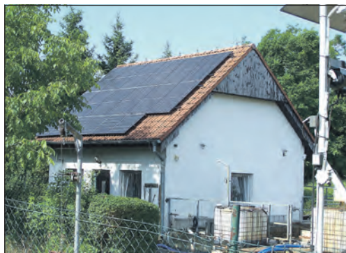
Fotovoltaické panely na střeše provozní budovy zlonické ČOV.

kazem toho jsou fotovoltaické panely jak na střeše budovy čističky, tak i v její těsné