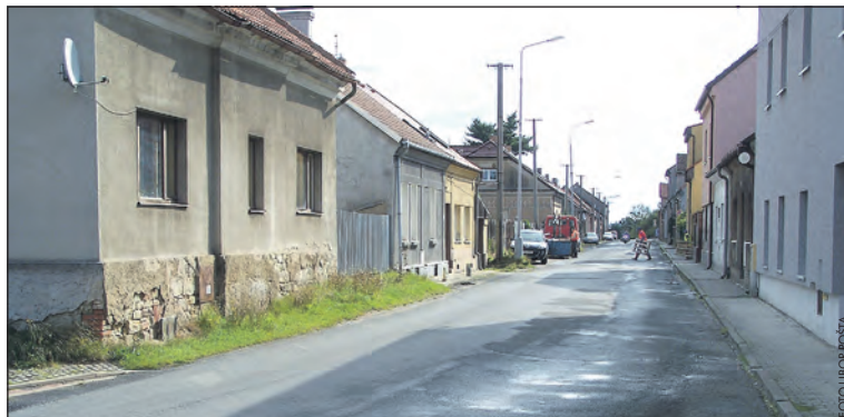
V první fázi projektu by se mělo přistoupit k rekonstrukci povrchů v této části Svinařovské ulice.

Oslovili jsme tedy sami pana projektanta se zadáním, aby na přilehlé nezpevněné části uličního prostoru vy-