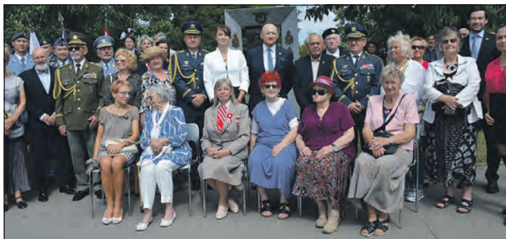
Vzpomínka u památníku se uskutečnila 14. srpna.