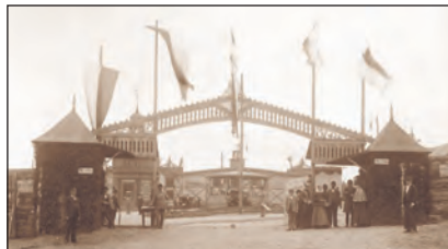
Vstupní brána na slánské výstaviště.

A stojíme před místností páně Pražáka, jenž skýtá nám i všem unaveným pivo zlonické. Neváhejte dovnitř! Byly sice doby, kdy na pivo to z jis-