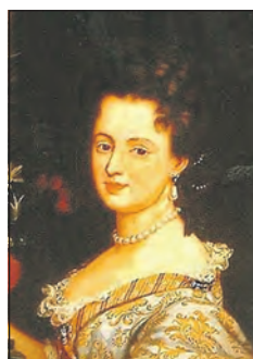
Anna Marie Františka velkovévodkyně Toskánská.