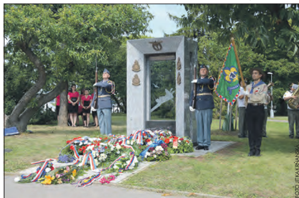
Památník připomíná událost, kdy se dne 13. srpna 1945 do osvobozené vlasti vrátili z Velké Británie čeští a slovenští letci ze čtyř československých perutí RAF.