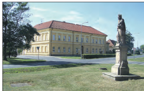
Nová fasáda na této škole byla již dokončena, teď už zbývá „jen namalovat“ před ní přechod pro chodce.