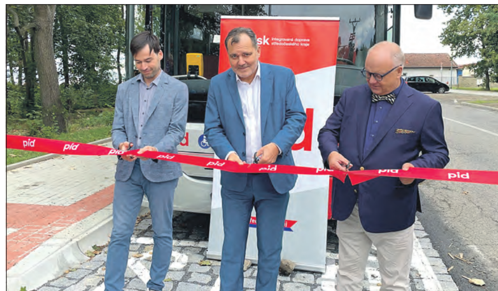
Slavnostní přestřižení pásky na nové autobusové zastávce „Slaný, Na Hájích“.