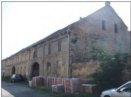
V tomto měsíci bude na této stodole zčásti vyměněna střešní krytina.

místostarosta Zlonic Zdeněk Imbr: „Po prodeji areálu starého zlonického areálu jsme museli vyřešit to, pod jakou jinou