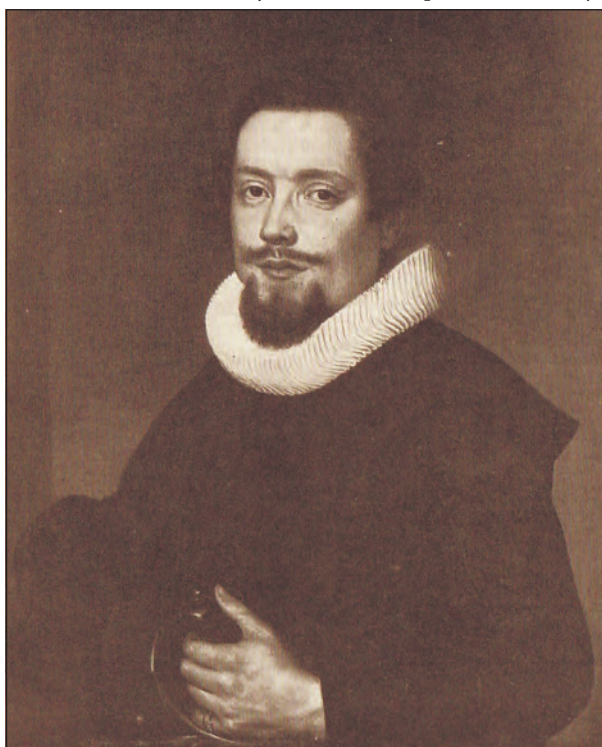
Jaroslav Bořita z Martinic.

sám, že do císařského důchodu odvede 200.000 míšeňských kóp. Za tuto ochotu připadlo mu nešťastné město Slaný se