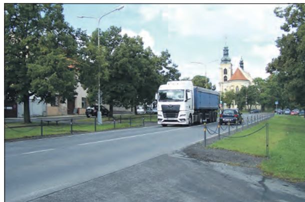
Na kamion, projíždějící smečenským náměstím, jsem musel čekat docela dlouho.