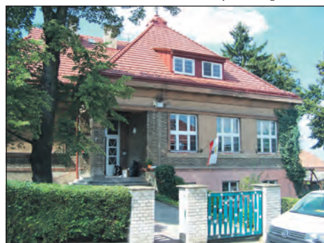
Školka v Tylově ulici ve Zlonicích.