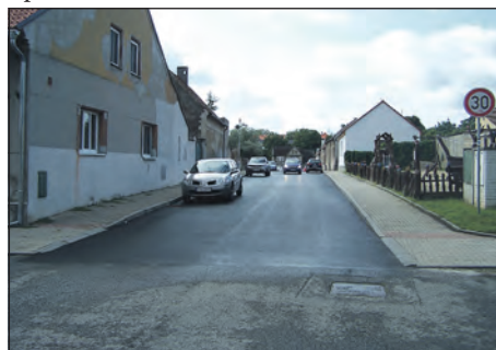
Školská ulice ve Smečně prošla náročnou rekonstrukcí.

ci ul. Školská, aby nám opravili jednak nájezd z ulice na silnici hlavní a současně opravili zmiňovanou plochu podél hlavní silnice. Techniku měli na místě, vidina nižší ceny tak byla zřejmá. Vše také s myšlenkou, že povrch vyznačíme bílým značením na asfalt pro účel parkování vozů osobních, a pokud už tam zastaví řidič vo-