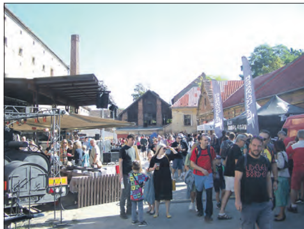
Na pivovarském dvoře to 28. září opravdu žilo.

Ano, chceme zde otevřít i restauraci a pivnici, a mít zde nějaký pěkný sál pro konání zimních akcí. Ten by se měl nacházet na místě původních štoků,