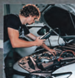
Kontrola vozidla před zimou pouze 400 Kč

Unhošťská 3287 272 01 Kladno – Kročehlavy www.toyota-louwman.cz