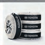
Výhodná nabídka kompletů zimních kol od 14 900 Kč