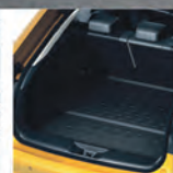
Vybrané originální příslušenství Toyota sleva 25 %