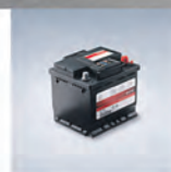
Autobaterie od 2 247 Kč