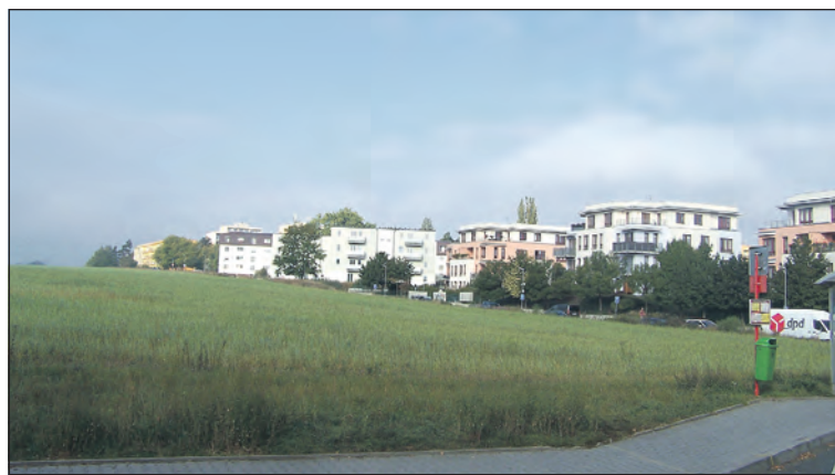
Horní část Nových Dolíků je ohraničena bytovými a panelovými domy.