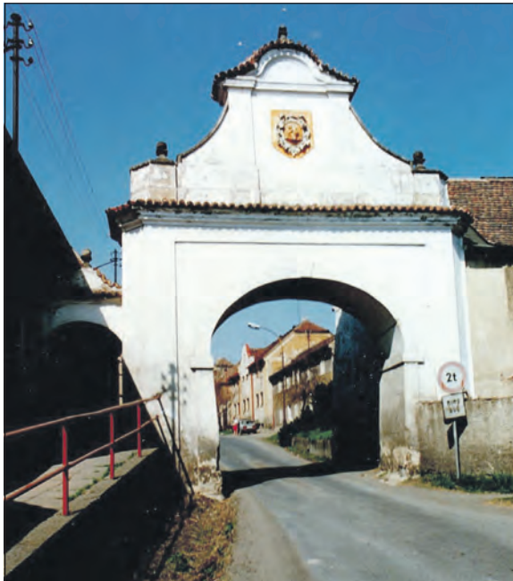
Vranská brána, z první poloviny XVI. století, je dochovaným zbytkem původního hrzení městečka Vraní.