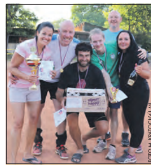
Vítězné družstvo turnaje.