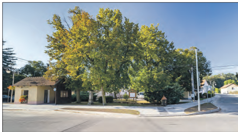
Jedna z nehezcích zastávek Včelí stezky se nachází na královické návsi, u autobusové zastávky.

zní pandemie covidu, protože takový projekt, který je zaměřený na ekologickou výchovu,