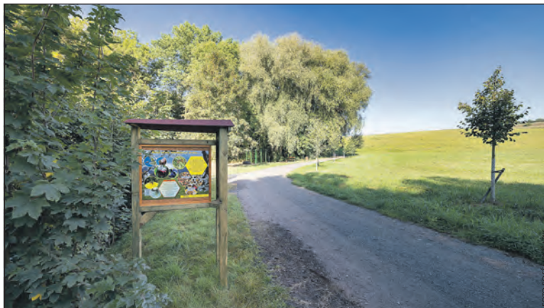
Jedna z „běžných“ zastávek na Včelí stezce.