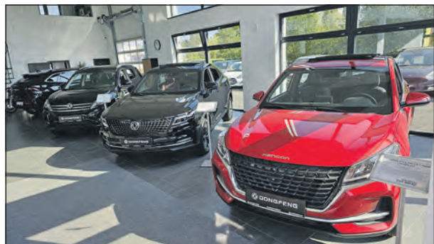
Interiér nového autosalonu s čínskými vozy Dongfeng.