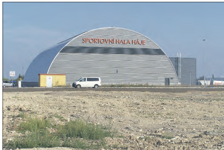
Nová sportovní hala ve Slaném, v lokalitě Na Hájích.