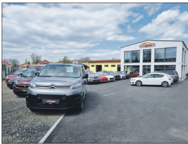
Areál společnosti Auto Velvex s.r.o. ve Slaném, Pražské ulici.