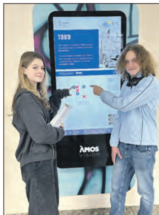
Digitální panel s informacemi o školních akcích.