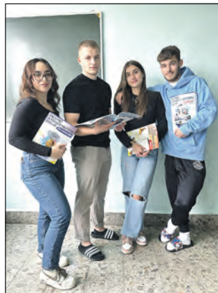
Skupina studentů Obchodní akademie Slaný.