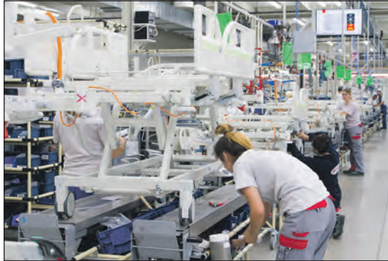
Montáž lůžek Eleganza ve výrobní hale ve Slaném, Na Hájích.

ho personálu a věříme, že část práce v budoucnosti zastanou smart technologie. Například chytrá místnost monitoruje bezpečnost, ať už se osoba nachází v nemocničním, důchodovém nebo domácím pokoji.