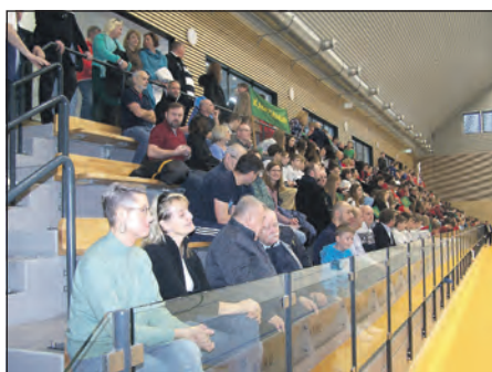
Dne 5. ledna byla slavnostně otevřena nová multifunkční stavba – Sportovní hala Háje. Pohled na tribunu pro cca 250 návštěvníků.

Vítěz vzejde na základě doplnění a zapracování připomínek odborné poroty, které byly předány oběma architektonickým ateliérům. Následně proběhne prezentace upravených studií a diskuze s odborníky a představiteli města. Libor Pošta