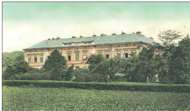
Všeobecná okresní nemocnice na dobové pohlednici.

3. Velkostatky a průmyslové závody v Slaném a okresu budte vyzvány k dobrovolným příspěvkům k uhrazení nákladu stavebního. Co by se pak ještě na stavbu a vnitřní zařízení nemocnice nedostávalo, má uhradit okres Slánský formou výpůjčky.