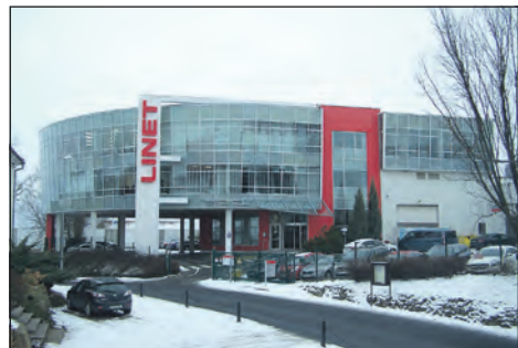
Sídlo společnosti ve Slaném - Želevčicích.