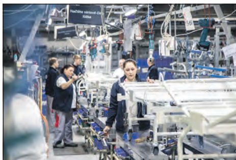
Montáž lůžek Praktika ve výrobní hale v Želevčicích. Zakázka pro Burkina Faso.

Každý konflikt je dříve nebo později velmi citelný v byznysu. V případě války na Ukrajině jsme zrušili naši pobočku v Moskvě a náš byznys, který jsme historicky budovali v Rusku, je nyní čistá nula. Dopady války v Gaze teprve ucítíme, reagovat bude celý re-