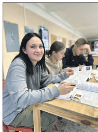
Studenti obchodní akademie Slaný při přípravě na výuku.