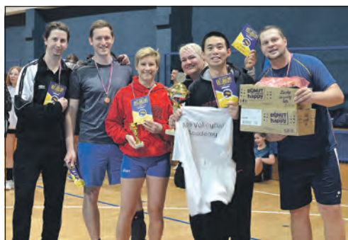
Vítězné družstvo Novoročního turnaje.

V zimní sezóně, kdy si sportovní duch nebere žádnou dovolenou, se ve Slaném odehrála dvě vzrušující a zároveň již tradiční volejbalová klání. Obou turnajů se zúčastnili hráči nejen ze Slaného, ale i z dalších měst, Kladna, Prahy, Plzně. Příbrami a Hradce Králové.