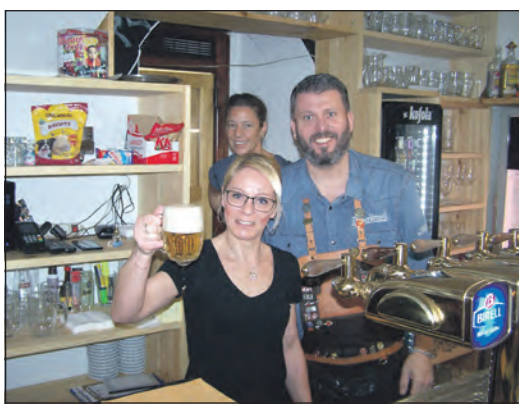
To je hladinka, co?