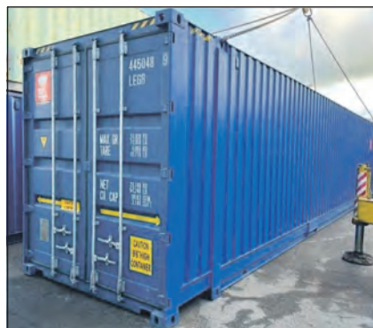
Do těchto velkoobjemových námořních kontejnerů se bude ve Smečně ukládat elektroodpad.

kompletně přehodnotit a také upravit svůj systém odpadového hospodářství tak, aby do bu-