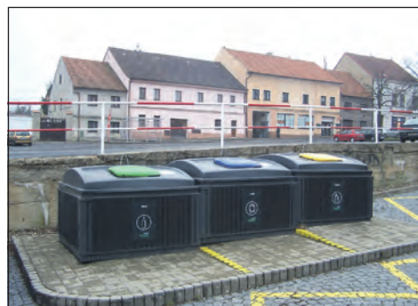
Jedno z míst, kde jsou ve Smečně umístěny podzemní kontejnery.