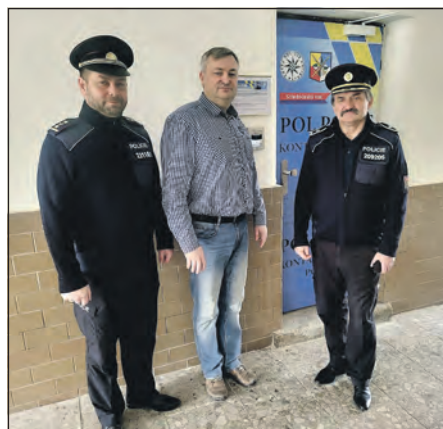
Starosta Smečna s příslušníky Policie ČR krátce po spuštění provozu smečenského Pol Pointu.

inovativní digitální služby přes třináct set občanů. Nejčastěji tímto způsobem občané oznamují případy tzv. IT kriminality – podvody, dále případy porušení občanského soužití, krádeže, zanedbání povinné výživy, poškození cizí věci, vydírání, výtržnictví, porušování