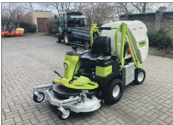
Město Smečno zakoupilo další sekačku pro pohodlnější, rychlejší a kvalitnější úpravu zelených ploch.

A kam s ním? Co zkusit využít prostor vedle vojenského skanzenu tak, že bychom vojenský skanzen rozšířili, vedle zkusili vyprojektovat pumtrackovou dráhu, která by plynule navázala na workoutové hřiště a fotbalový stadion. Doplněno o zeleň, výsadbu stromů a keřů, byla by z toho prima lokalita. Projekt studie jsme právě zadali. -lp-