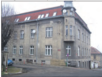
Obecní byty městyse Zlonice se nacházejí také v budově zlonického zdravotního střediska.

převyšuje 5000 Kč. V novém nájemném je kalkulován stav a dispozice bytu. Třeba pokud je WC mimo byt, je nájemné nižší. U smluv, kde výše nájmu již odpovídá stavu bytu, je ná-