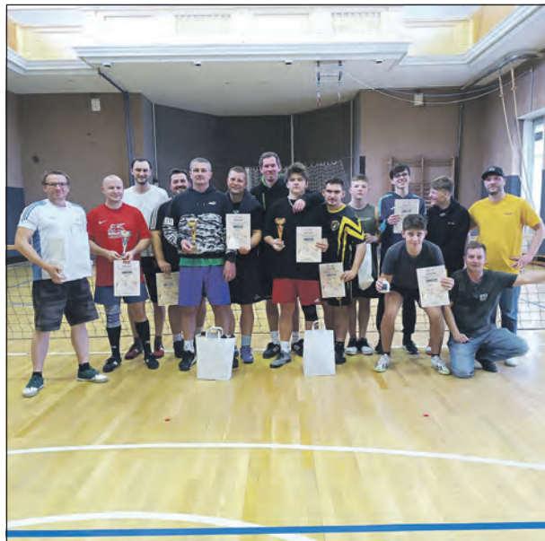
První čtyři týmy turnaje příchodích.