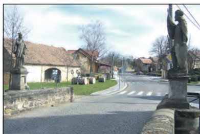
Nové silnice by měly být v Královicích zhotoveny do konce srpna tohoto roku. Snad se budou líbit i svatému Václavovi a svatému Janu Nepomuckému.