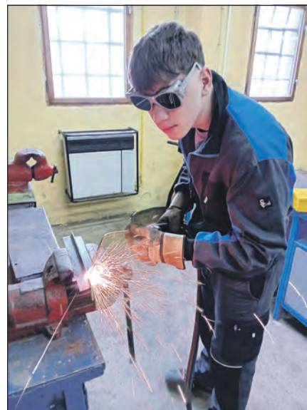
Pohled do školních dílen. První ročník - instalatéri.

Musím zmínit také kurzy, které žákům hradíme, a myslím si, že je to pro jejich další činnost v oboru velký přínos. Např. žáci oborů strojní mechanik a strojírenské práce absolvovali svářečský kurz v Hospozíně, instalatéri absolvovali kurz pájení mědi a svařování plastů. Poprvé jsme podali žádost o dva granty z NROSu a k naší velké spokojenosti jsme