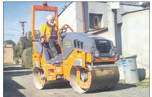
Oprava povrchu komunikace v místní části Zlonic, v Břeštaněch, v březnu 2024.