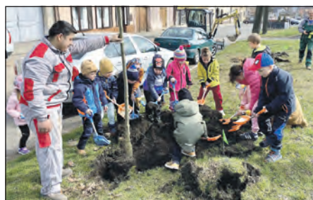
Děti z místní MŠ sázejí lípu poblíž budovy MěÚ Smečno.

A kdo vůbec pět nových lip sázel? To mně prozradil rovněž starosta Smečna: „Tato především administrativní záležitost zabrala spoustu času, ale nakonec nám nadešel onen kýžený den ‚D‘, a my jsme mohli k odbornému sázení zahradníkem přizvat i děti z místní mateřské školy ve Smečně, aby nám pomohly s výsadbou a doplněním chybějících stromů na náměstí. Vybaveny byly vlastní lopatičkou a ruku k dílu