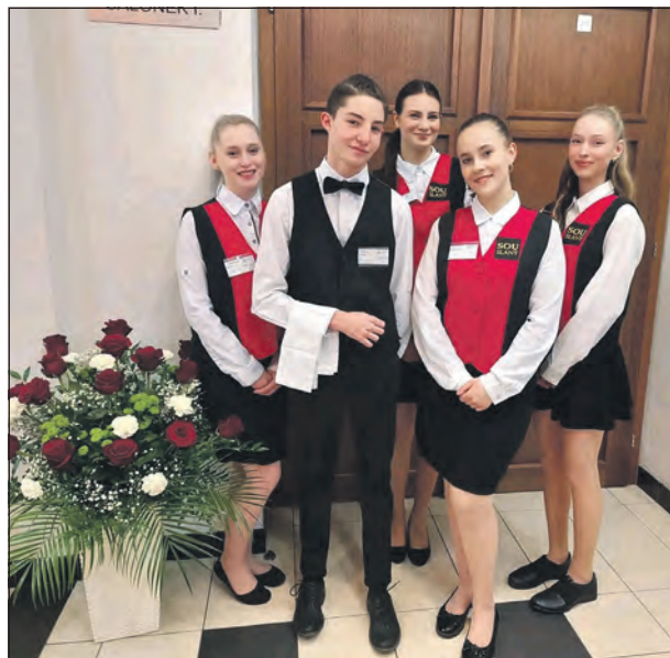
Pomoc na plesu města Slaného.

číslem a dalšími náležitostmi o správním řízení. Výsledky přijímacího řízení škola zveřejní 15. května 2024. Seznam bude vyvěšen na našich webových stránkách a ve vestibulu