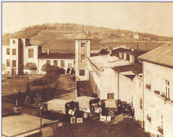
Autopark firmy Pála a spol. v novém závodě.