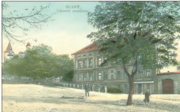
Okresní sirotčinec na dobové pohlednici.

Laskavou ochotou okresního tajemníka pana Mayssla poskytl se nám příležitost budovu nového sirotčince si pro-